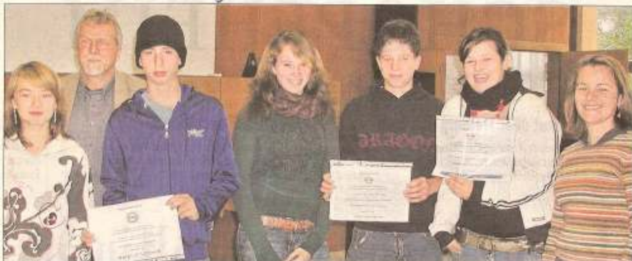
„Be smart, don't start“ heißt der internationale Nichtraucherwettbewerb, an dem sich eine siebte und zwei achte Klassen am THG beteiligten. Sie erhielten Preise für die Teilnahme.